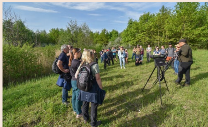
Každý rok pořádá Česká společnost ornitologická řadu osvětových a pracovních vzdělávacích akcí pro širokou veřejnost. Navštivte www.birdlife.cz/prehled-akci-cso .