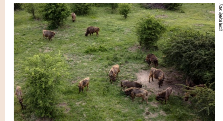
Na části území chceme zavést pastvu kopytníků jako v ostatních ptačích parcích ČSO. Velcí spásací udržují louky pestré a bohaté na hmyz, který je důležitou potravou ptáků.