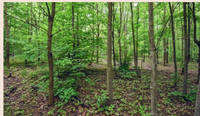
Většina zdejších lesů je příliš hustá a není v nich dostatek světla. Prosvětlením těchto porostů tak připravujeme vhodné podmínky pro celou řadu vzácných a ohrožených druhů.