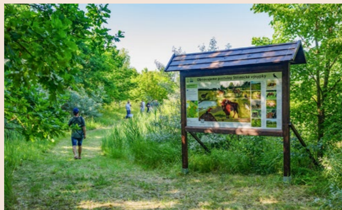
V jižní části parku jsme vybudovali naučnou stezku seznamující s typickými biotopy ptačího parku a našimi plány na jejich obnovu.