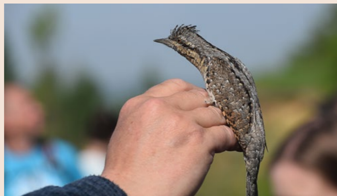
Návštěvníci akcí pro veřejnost mají příležitost potkat některé obyvatele parku skutečně zblízka. Zde například krutihlava obecného, který má v oblíbených především staré ovocné sady.