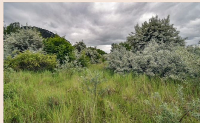
Zaměřujeme se na odstranění invazních druhů rostlin. Například původně asijské hlošina úzkolistá (na snímku s šedými listy) vytváří místy neprostupné porosty.