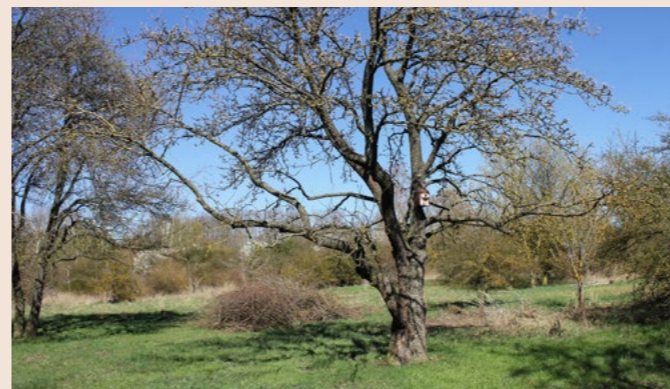
V severozápadní části parku jsme obnovili starý sad, včetně výsadby nových ovocných stromů starých odrůd. Výsadba ovocných stromů probíhá i na dalších místech v parku.