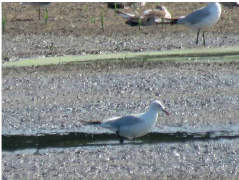
Obr. 3. Racek tenkozobý ( Chroicocephalus genei ), Hodonín (okres Hodonín), 11. června 2017 – první prokázaný výskyt v České republice.

Po zveřejnění revize avifauny ČR (Vavřík et al. 2019) jsme šťastnou náhodou narazili na existenci dokladu prvního pozorování tohoto druhu na našem území, které dosud nebylo nikde zveřejněno. Racek tenkozobý zalétává v květnu a červnu nepravidelně na sever – v sousedním Polsku (zejména v jeho jižní části) byl do roku 2019