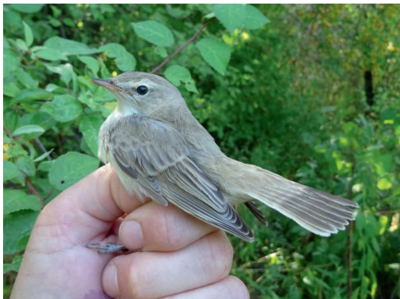
Obr. 5. Sedmihlásek malý ( Iduna caligata ), Praha-Uhřetěves, 31. srpna 2019. Fig. 5. Booted Warbler ( Iduna caligata ), Praha-Uhřetěves (City of Prague), 31 August 2019.

Třetí záznam po odchycích v září 2013 a srpnu 2015 na Červenohorském sedle. Pro srovnání v Polsku byl v květnu 2019 zaznamenán již pátý výskyt tohoto druhu (Komisja Faunistyczna 2020).