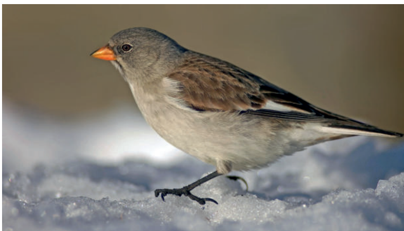
Obr. 7. Pěnkavák sněžný ( Montifringilla nivalis ), Trojmezná, Stožec (okres Prachatice), 19. února 2019.

První akceptované pozorování od doloženého záznamu z Orlických hor ze srpna 1979 (viz Vavřík et al. 2019). Existuje několik dalších nedoložených záznamů, které