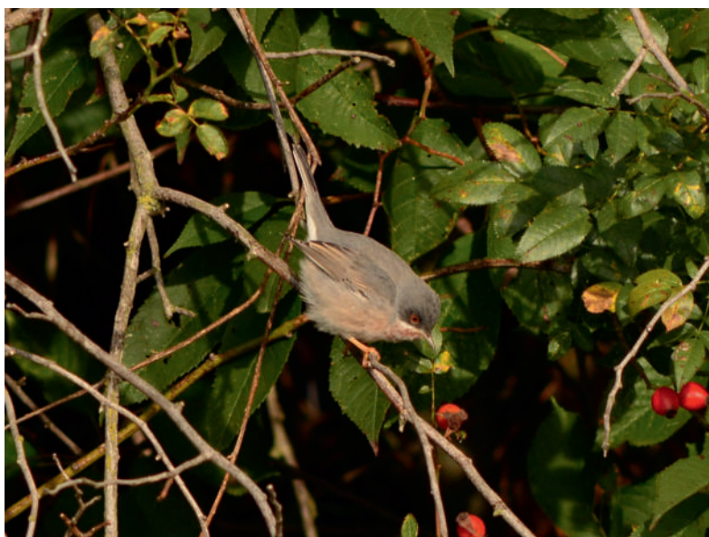
Obr. 6. Pěnice vousatá ( Sylvia cantillans ), Radonín (okres Třebíč), 16. září 2019. Fig. 6. Subalpine Warbler ( Sylvia cantillans ), Radonín (Třebíč district), 16 September 2019.