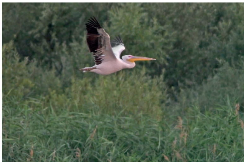
Obr. 2. Pelikán bílý ( Pelecanus onocrotalus ), Vodní dílo Nové Mlýny II (okres Břeclav), 26. července 2019.

06.03.2019: 1 ex. Brno, BM, JHM (T. Dihlof; foto; FK 14/2019)