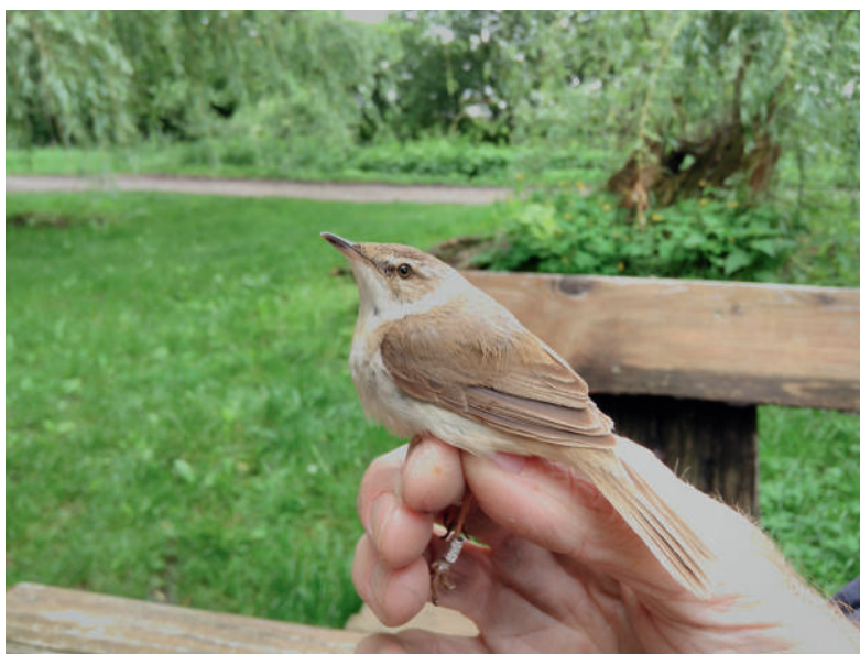
Obr. 4. Rákosník plavý ( Acrocephalus agricola ), Mutěnice (okres Hodonín), 23. května 2019.

Po prvním odchytu v srpnu a září 2016 jsou tři odchty v jednom roce velkým překvapením. Pro srovnání v Polsku bylo v roce 2019 schváleno jen jediné pozorování (18. 5.; Komisja Faunistyczna 2020). Areál rákosníka plavého se táhne z centra výskytu ve střední Asii na západ kolem Černého moře až do Bulharska; rákosníci plaví táhnou do Indie právě podél severního pobřeží Černého moře, část ptáků ale letí opačným směrem k jihozápadu a byli zaznamenáni na Maltě, v Řecku, Itálii a několik zimujících ptáků také až na Sardinii (Zehtindjiev et al. 2010).