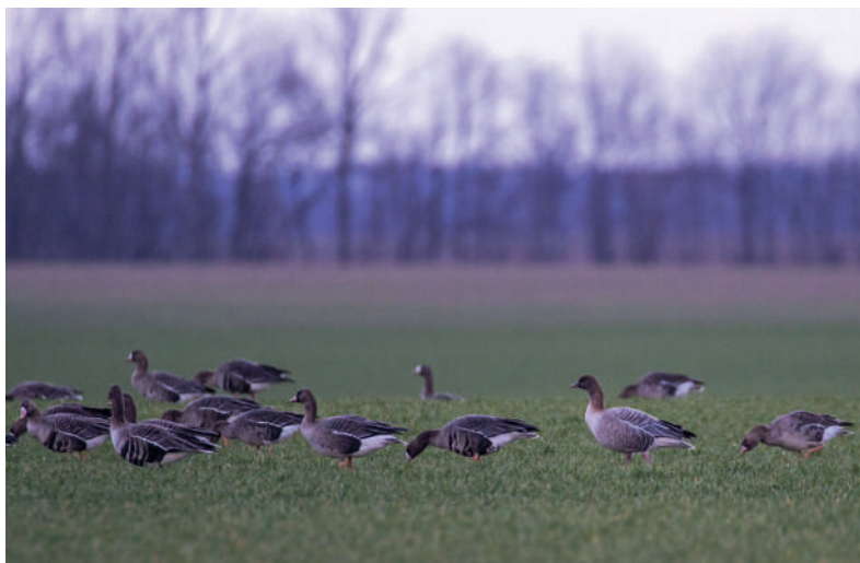
Obr. 1. Husa krátkozobá ( Anser brachyrhynchus ), Oleksovice (okres Znojmo), 11. března 2019 – první prokázaný výskyt v České republice.