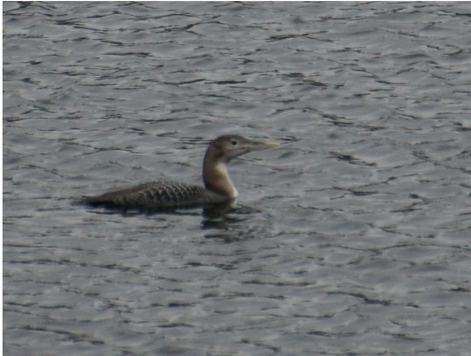
Obr. 3. Potáplice žlutozobá ( Gavia adamsii ), Plumlov (PV), prosinec 2016 – čtvrtý výskyt v ČR.

V roce 2014 bylo v Británii zaregistrováno 35 ptáků, druhý nejvyšší počet v historii; počty pozorovaných ptáků nadále rostou (White & Kehoe 2016).