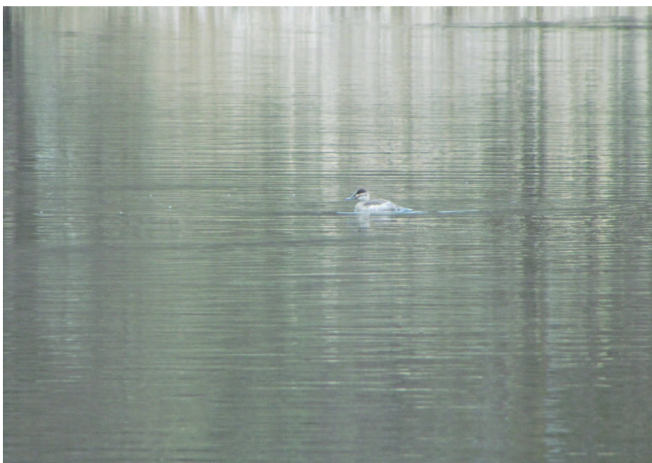
Obr. 2. Kachnice kaštanová ( Oxyura jamaicensis ), Žďár nad Sázavou, březen 2016.

Naposledy byla zjištěna v roce 2011. Další pozorování tohoto druhu z kategorie C jsou čím dál tím méně pravděpodobná s ohledem na program jeho likvidace v západním Palearktu do roku 2020 (Directorate of Democratic Governance 2016). Centrem výskytu v Evropě byla Velká Británie, kam byla kachnice kaštanová introdukována v roce 1949. Ve volné přírodě zahnízdila poprvé v roce 1960, posléze se rozšířila i do dalších zemí, především do Španělska, kde začala ohrožovat místní populaci kachnice bělohlavé ( Oxyura leucocephala ). Do roku 2000 vzrostla britská volně žijící populace na 6 000 jedinců. Programy eliminace druhu probíhaly v letech 1993–1996 a poté od roku 1999. V roce 2013 tak britská populace čítala už jen pouhých 45 jedinců (Sarat 2015).