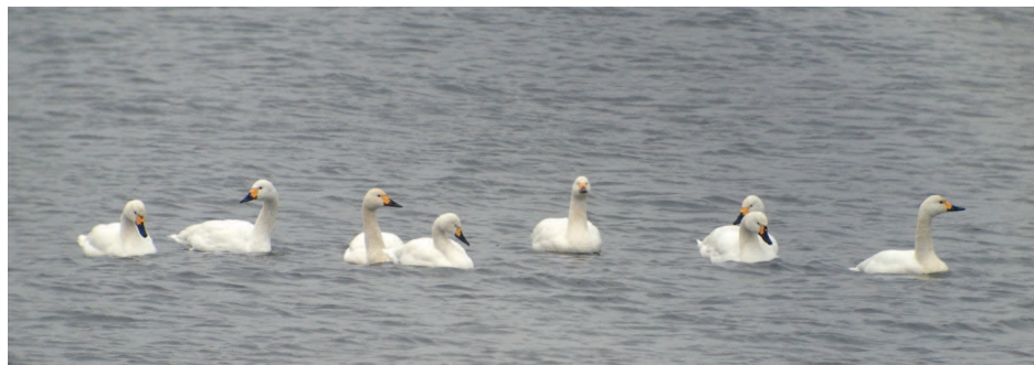
Obr. 1. Labuť malá ( Cygnus columbianus ), Kyjice (CV), leden 2016.

Jde teprve o třetí záznam hejna, předchozí pochází z 27. 3. 1983, kdy bylo pozorováno 15 ex. na úd. n. Rozkoš (V. Koza) a 23.–24. 2. 2001, kdy se na rybníce u Šumvaldu zdržovalo hejno dokonce 20 ptáků (M. Vavřík a další).