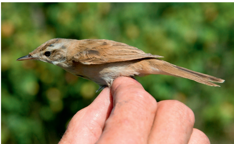
Obr. 7. Rákosník plavý ( Acrocephalus agricola ), Hrabanovská černava (NB), srpen–září 2016 – první výskyt v ČR.

27.08., 04. a 09.09.2016: 1 ex. 1K chycen Hrabanovská černava, NB, StČ (K. Pithart, J. Šimek aj.; foto; FK 103/2016; obr. 7)