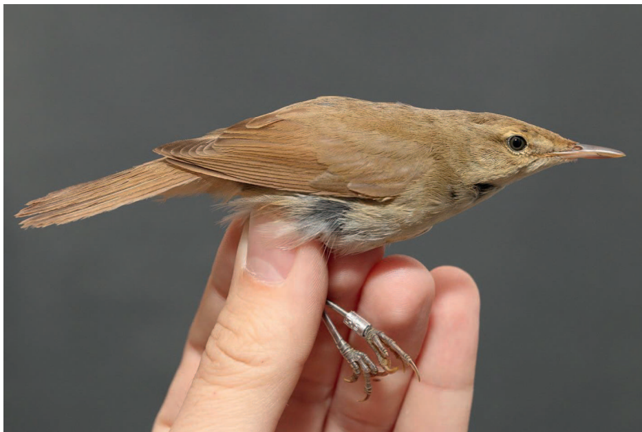
Obr. 8. Rákosník pokřovní ( Acrocephalus dumetorum ), Valašské Meziříčí (VS), říjen 2016 – třetí výskyt v ČR.

Po prvním pozorování v roce 2014 a druhém v roce 2015 byl tento nenápadný rákosník zjištěn potřetí.