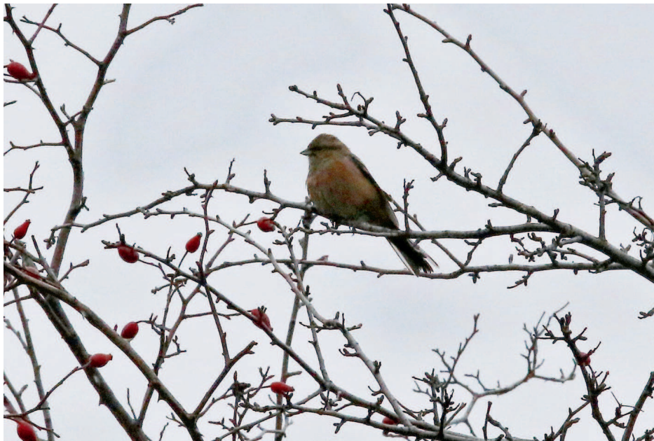
Obr. 12. Strnad viničný ( Emberiza cia ), Perná (BV), listopad 2016– první záznam od roku 1950.

Fig. 12. Rock Bunting ( Emberiza cia ), Perná (Břeclav district), November 2016 – 1 st record since 1950.