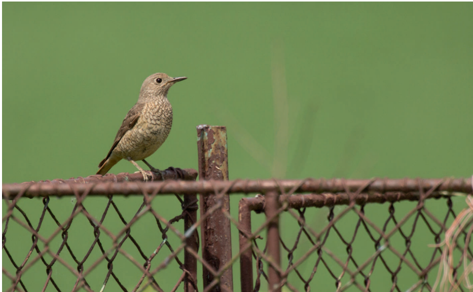
Obr. 10. Skalník zpěvný ( Monticola saxatilis ), Chuchelna (SM), květen 2016.

Fig. 10. Rock Thrush ( Monticola saxatilis ), Chuchelna (Semily district), May 2016.