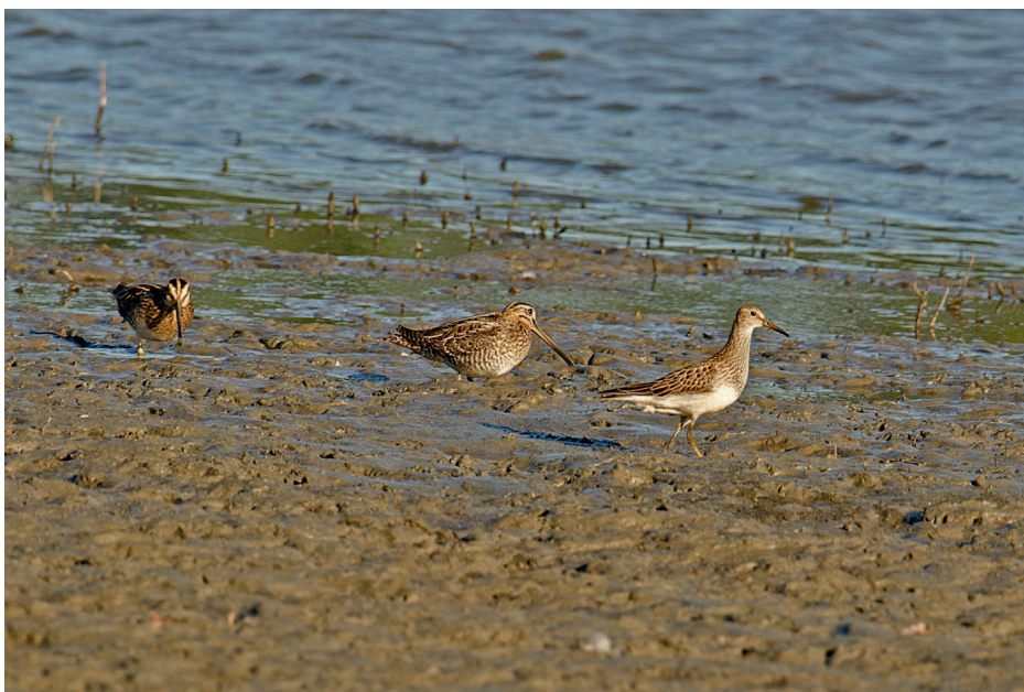
Obr. 4. Jespák skvrnitý ( Calidris melanotos ), Pištín (CB), červen 2016.

28.–29.06.2016: 1 ex. 1K Pištín, CB, JČ (F. Pochmon aj.; foto; FK 105/2016; obr. 4)